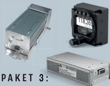
PAKET 3: ACD-57 Display VT-01 Transponder AC-1 Funkgerät