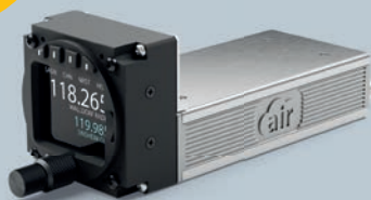
PAKET 2: ACD-57 Display AC-1 Funkgerät