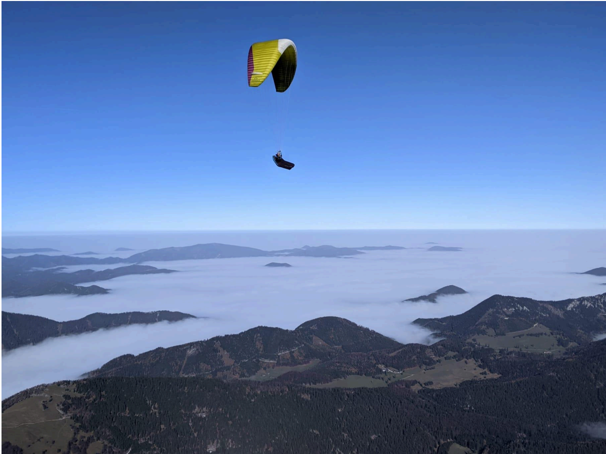
Schneeberg bei Wien.