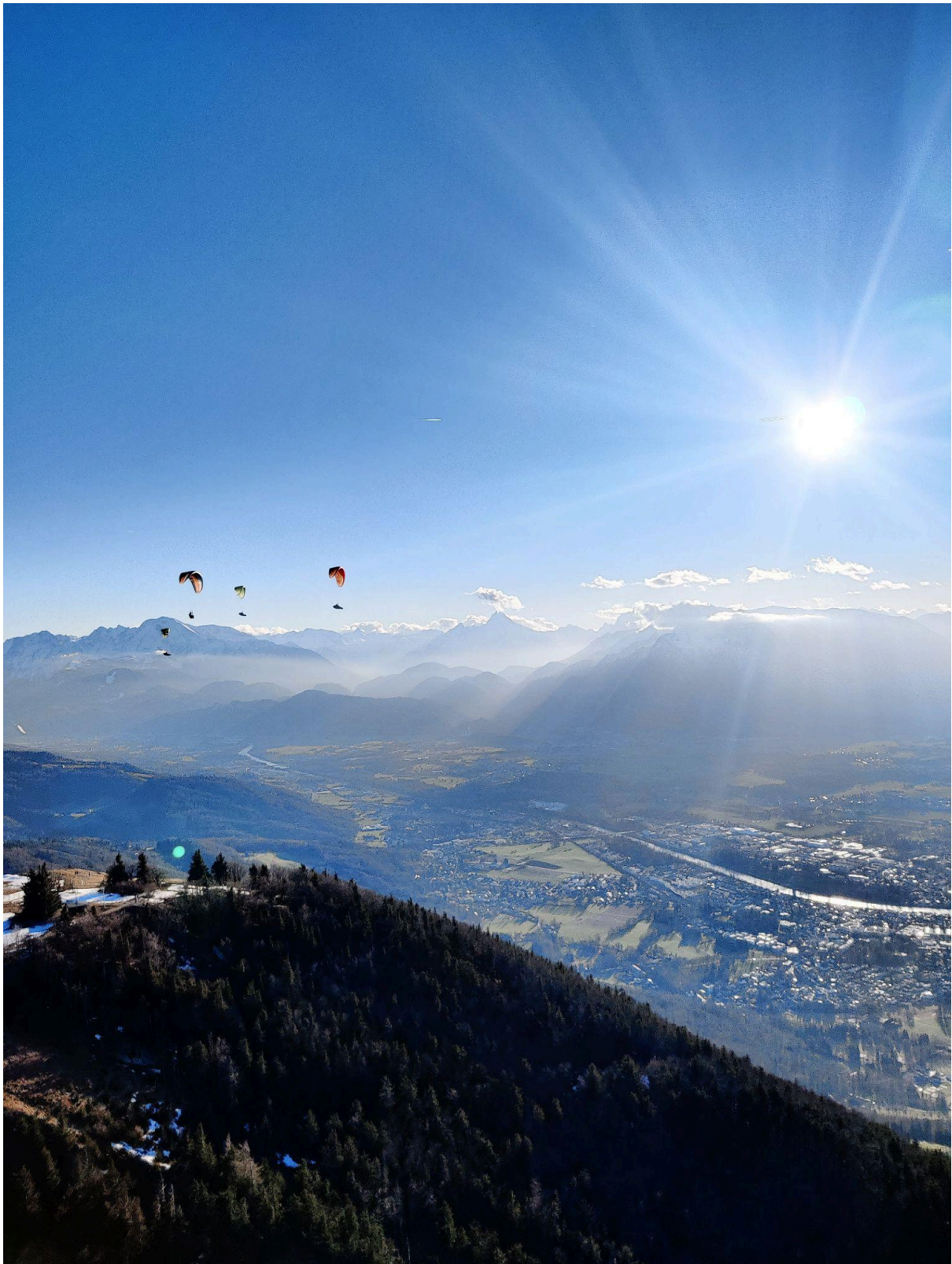
Gaisberg, Salzburg, Januar 2024.