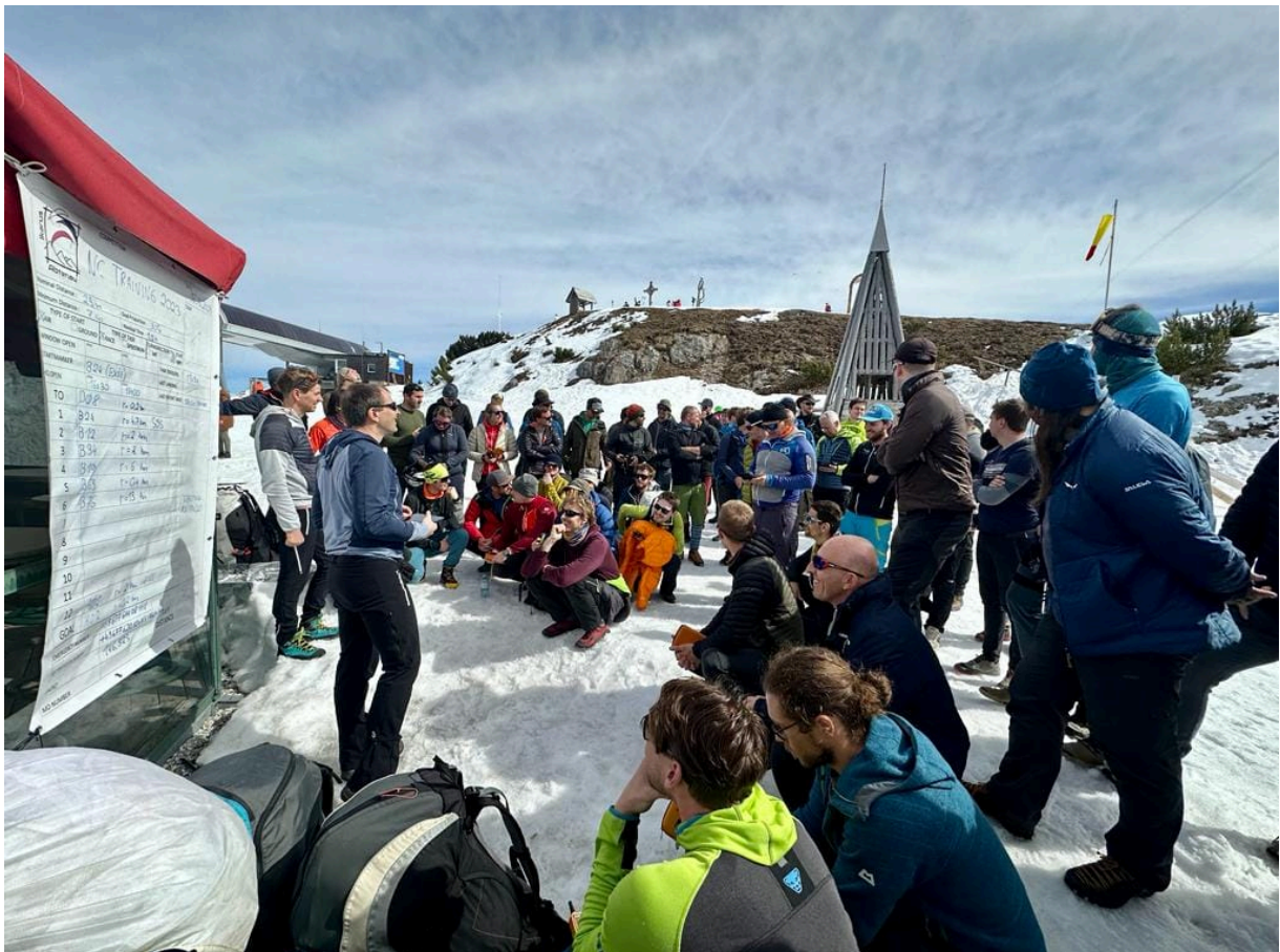
Briefing beim Newcomer Trainingslager 2023

https://www.youtube.com/watch?v=TtqF7dJiqI