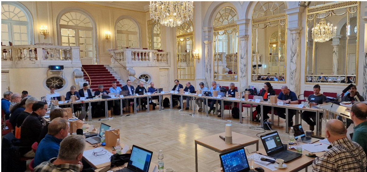
EHPU Treffen im Spiegelsaal des Haus des Sports / AeroClub, Wien