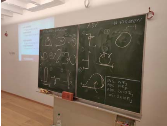
Figurenauswahl beim Eröffnungsbriefing