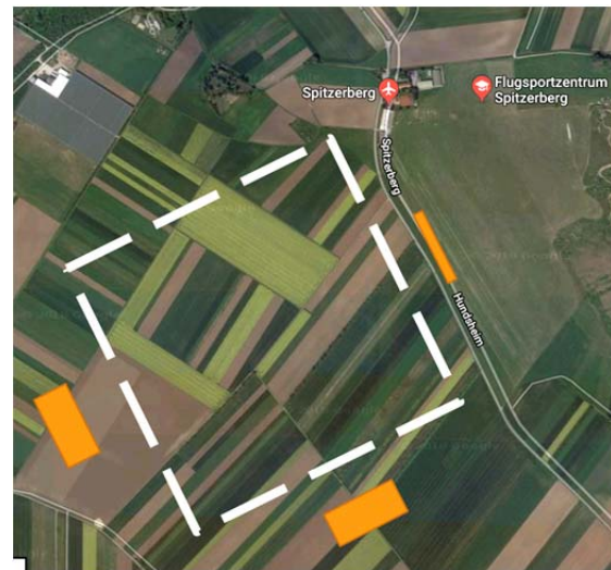
Die Kunstflugbox 2018 neben dem Spitzerberg

eignen gibt es hier auch ausreichend Abstand zu den umliegenden Ortschaften. Die für Kunstflieger als Referenz so wichtige Horizontlinie ist im Bereich Spitzerberg, anders als im größten Teil des restlichen Bundesgebietes, in allen Richtungen sichtbar und eben.