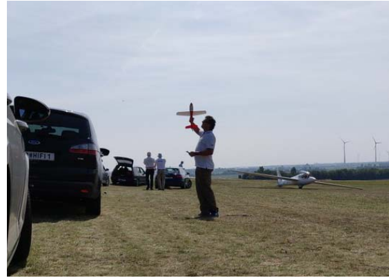
Wenn's mit dem kleinen Flugzeug funktioniert, muss es mit dem großen auch klappen - Gerhard Saumwald studiert das Programm ein

Siggi Mayr holte sich den Sieg in diesem Durchgang und somit auch den Gesamtsieg in dieser Wettbewerbsklasse, Gabriel Stangl und Bernhard Behr belegten in diesem Durchgang und auch in der Gesamtwertung die Plätze 2 und 3.