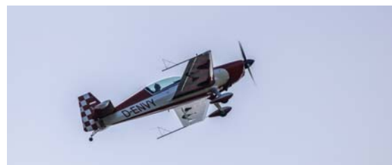
D-ENVY im Anflug auf die Box

Wesentlich höhere Effizienz bewiesen am Nachmittag die Motorkunstflieger, die ihren kompletten Durchgang mit 15 Teilnehmern in nur knapp 4 Stunden flogen. Während sich ein Teilnehmer in der Box befand wartete bereits der nächste am Taxiway, beendete ein Teilnehmer den Kunstflug startete der nächste postwendend und war bereits nach zwei weiteren Minuten bereit zum Beginn des Programms.