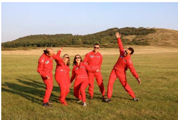
Sportsmen Power – aerobatic team 3fly