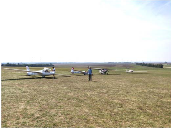
Bereit für die ersten Wertungsflüge

Während des Vormittages flogen die Segelkunstflieger in gemischter Startreihenfolge in den Klassen Unlimited und Advanced das erste Programm- die Free Known. Dieses Programm setzt sich aus 5 jeweils jährlich von der FAI / CIVA vorgegebenen Figuren und 5 frei wählbaren Figuren zusammen und muss festgelegten Schwierigkeitsgraden (K-Faktor) und Reichhaltigkeitserfordernissen (Auswahl verschiedener Figuren) entsprechen.