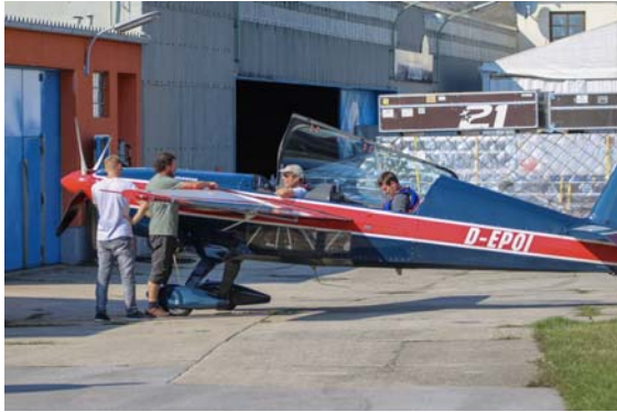
Die Tankstelle – dieser Tage gut besucht.

Die Wertungsklassen Intermediate und Sportsmen Motorflug hoben an diesem Tag noch einmal zu einem letzten Flug, ebenfalls dem Wertungsdurchgang 4, ab.