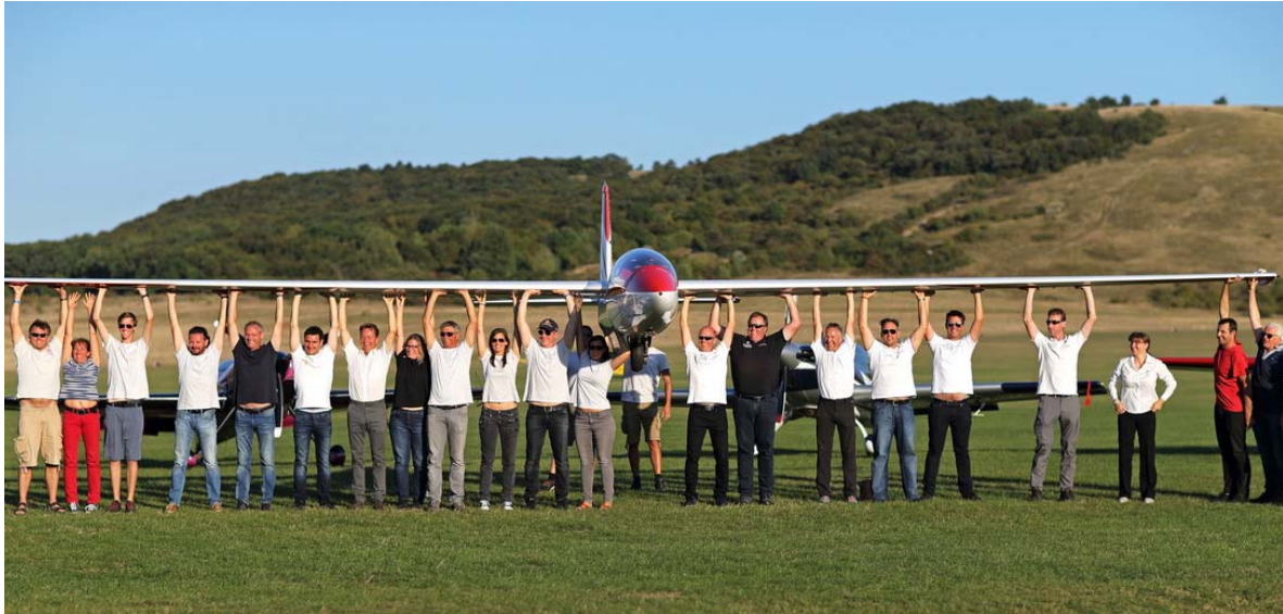
Die Teilnehmer 2018