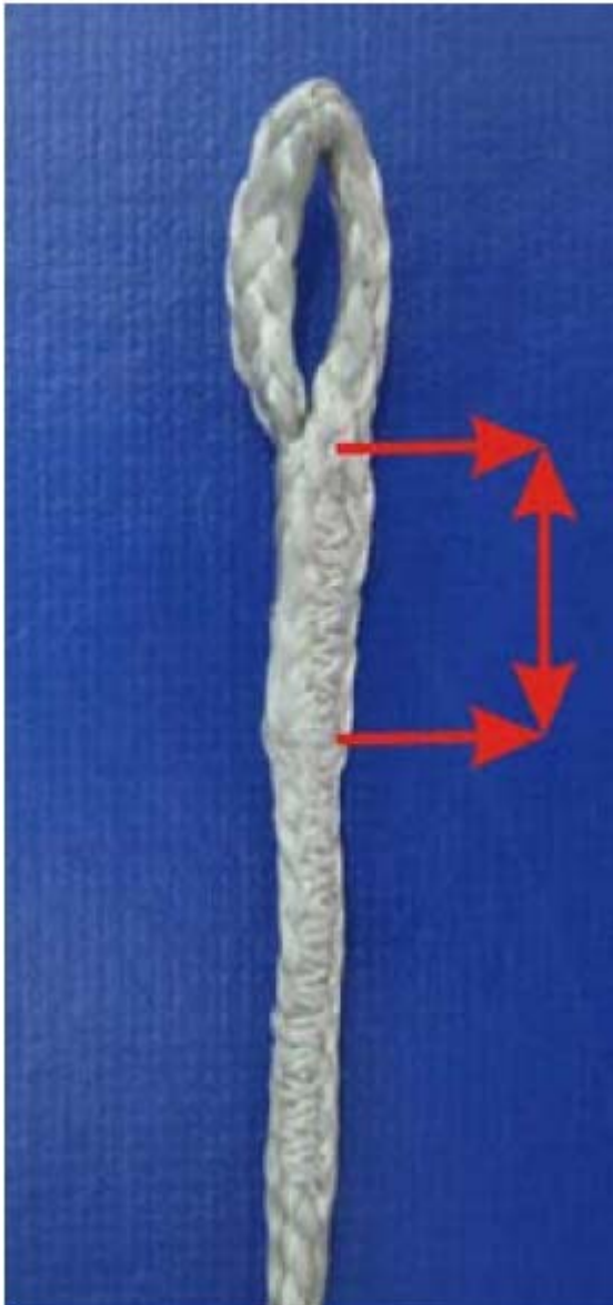
Abbildung 1 Abbildung 2

Abbildung 1 zeigt die potentiell betroffenen Stellen der Tragegurte. Abbildung 2 zeigt eine fehlerhafte Verspleißung.